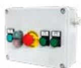
9.039.04.001 ● ● ● Comando a distanza / Remote control