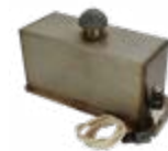
3.056.04.002 ● ● ● ● Vasca anticalcare / Antiscale tank