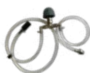
3.003.34.002 ● ● ● ● Kit erogazione esterna detergente External detergent kit