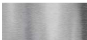
1.075.04.007 ● ● ● ● Pannello posteriore / Rear panel